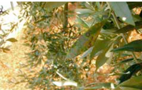
L'œil de paon fait tomber beaucoup de feuilles

Avec un délai avant récolte de 30 jours il sera à utiliser essentiellement pour un traitement en septembre ou pour un traitement après la récolte.