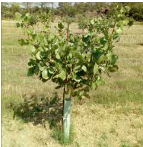
3 ans après la greffe, le plant a bien pris, il produira ses premières pistaches dans 1 ou 2 ans

Il vous faut déjà avoir des greffons, avoir réussi à bouturer ou replanter des pistachiers térébinthe en pots, puis, il faut arroser 1 ou 2 fois le porte-greffe dans le mois qui précède l'intervention et encore 1 ou 2 fois après, protéger le greffon... et croiser les doigts et planter le tout... Le taux de réussite reste assez bas, mais c'est une jolie aventure.