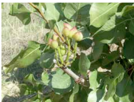
Les premiers fruits pendant l'été, ils doivent encore mûrir pendant 1 ou 2 mois.