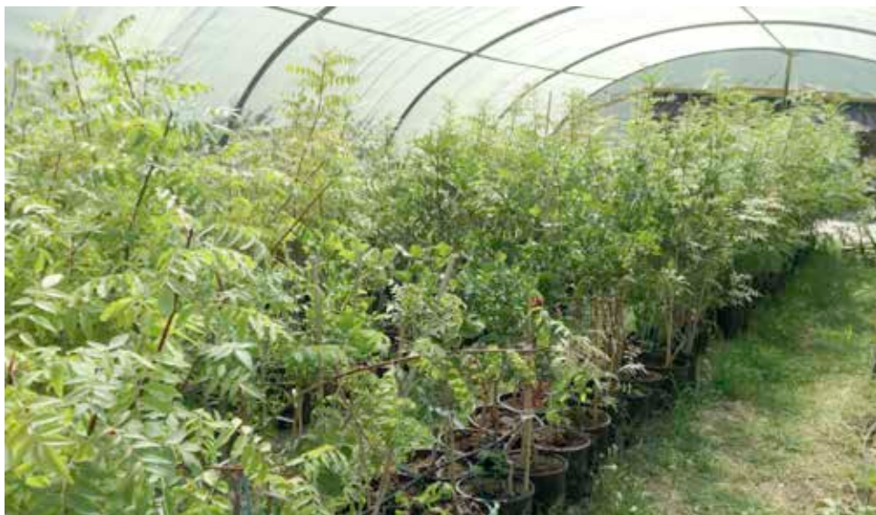
Pépinière de pistachiers attendant d'être greffés.