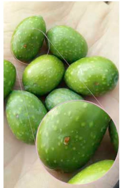
Après la piqûre de ponte vous avez 4 semaines avant que l'olive ne s'abîme.

Rendez-vous jeudi 9 septembre 2021 à 9 h aux Mées (RDV : GPS 44.009982, 5.959381)