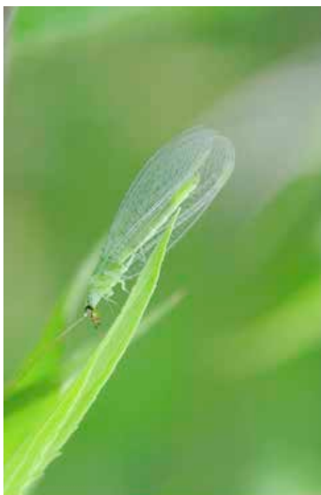
Un adulte de Chrysope, un bon ami de l'oléiculteur

Olivette infos : C'était juste une plaisanterie, fil à retordre – teigne – fil de soie... vous voyez c'est rapport aux fils de soie que tissent les chenilles de teigne.