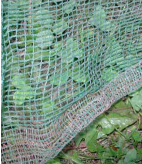
Avec les filets renforcés aux bords cousus les risques de trous sont bien réduits

- Mettez vos peignes électriques à charger, reprenez vos filets et rassemblez vos caisses.